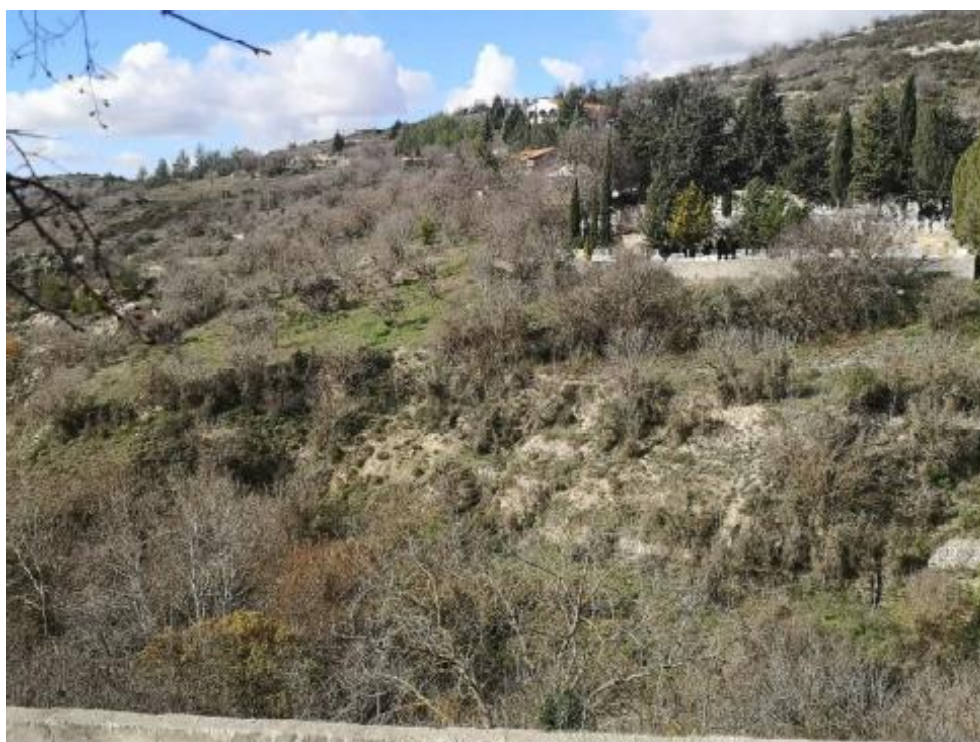
Η άμεση περιοχή των τεμαχίων 690 και 689.