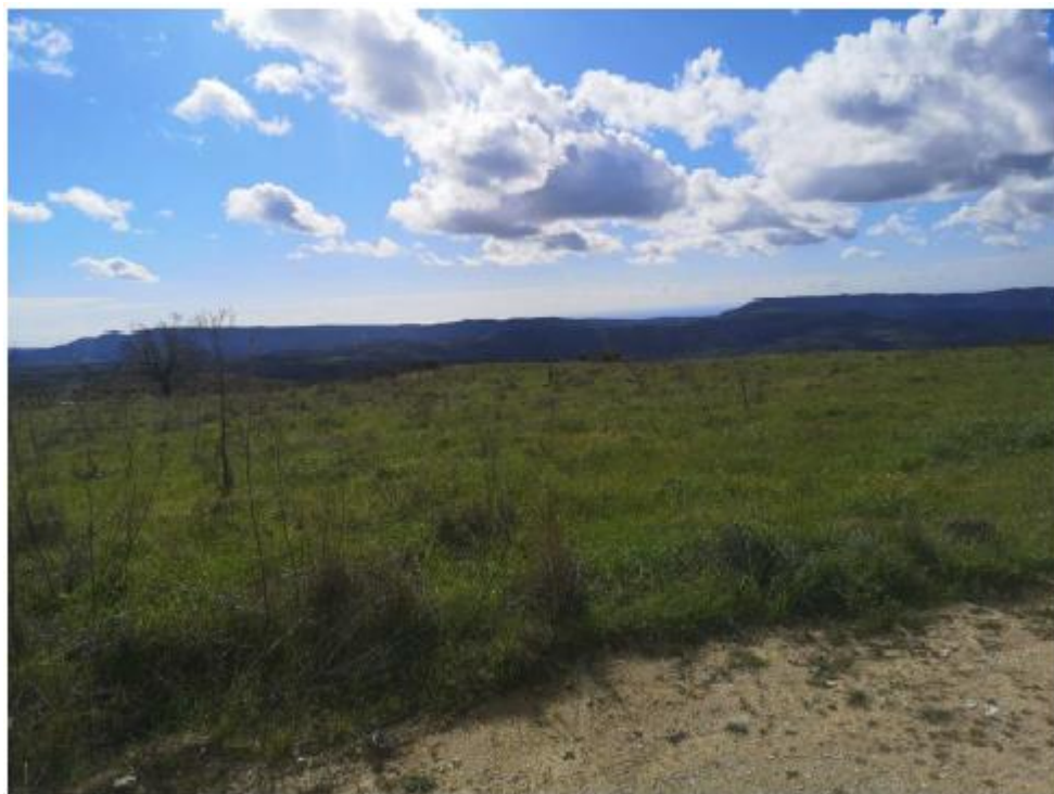
Μέρος του εξεταζόμενου τεμαχίου 184.